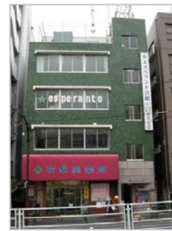
エスペラント会館 （東京都新宿区） 一般財団法人 日本エスペラント 協会の事務局

日時：9月29日(土) 14:00~17:00 会場：エスペラント会館（新宿区早稲田町） 内容：国際行事の体験報告 ベトナムでの UK（世界大会） IJK（国際青年大会） ウクライナでの盲人大会 東京での Somera Esperanto-Kunveno 中国・海南島での4週間集中学習合宿 連絡先：田中禎一（電話 090-5572-4585） メール korno@esperanto.ne.jp