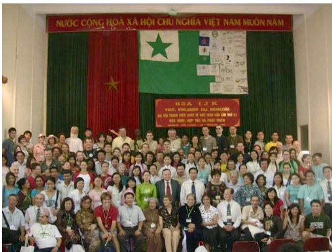
左の写真は、青年大会の開会式

※国際青年大会は Internacia Junulara Kongreso と言います。