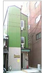
エスペラント会館 (京都市下京区)