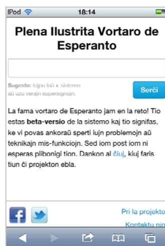
ネット上の辞典 (iPod Touch 画面)

注1) vortaro は辞典という意味です。 vorto (単語) に -ar- (集団の意味) を付けた合成語です。 ヴォーろターろ ヴォーろト アー