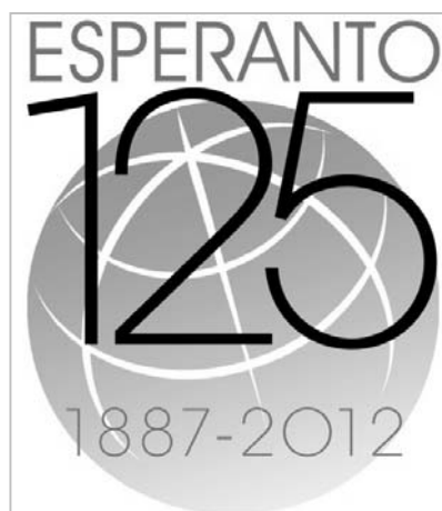
エスペラント発表125周年ロゴ (世界各国で使用)

一般財団法人 日本エスペラント協会 普及推進部・ウェブ管理部(担当：森川 和徳) 〒162-0042 東京都新宿区早稲田町12-3 電話 03-3203-4581 FAX 03-3203-4582 ホームページ http://jei.or.jp/ 電子メール esperanto@jei.or.jp