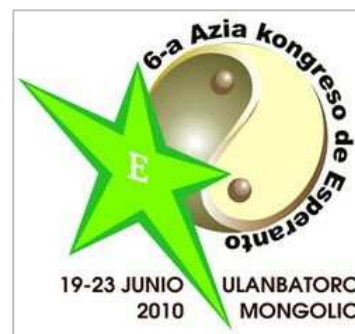
第 6 回アジアエスペラント大会のシンボルマーク

アジアのエスペラント運動が活発になっており、アジア大会が 1996 年から 2~3 年に 1 回開催されています。第 6 回アジア大会が 6 月 19 日~23 日の 5 日間、モンゴルのウランバートルで開催されました。33 カ国から 254 人が参加し、そのうち、日本からは 75 人が参加しました。大会にはスフバートル・バトボルド首相からの祝辞もありました。世界エスペラント協会・アジアエスペラント運動委員会の新委員長に佐々木照央氏 (埼玉大学教授) を選出。次回大会は 2013 年にイスラエルで開催されます。