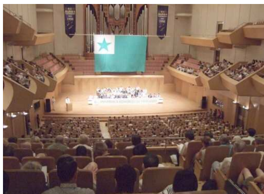
2007 年に横浜で開催された 第 92 回世界エスペラント大会の開会式

世界エスペラント大会は 1905 年に第 1 回大会がフランスで開催され、二度の世界大戦の時期を除き、毎年開催されました。近年はヨーロッパとヨーロッパ以外で交互に開催されています。昨